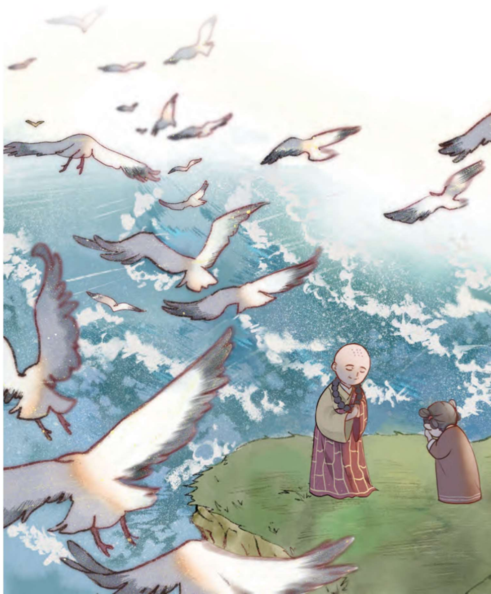
善財童子五十三參之二——海雲比丘